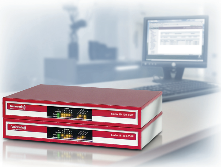
bintec Media Gateways R1200-VoIP und R4100-VoIP

Als Fachhändler für Tobit.Software und zertifizierter »Tobit Premium Partner« ermöglicht das bundesweit agierende Unternehmen das reibungslose Zusammenspiel zentraler Kommunikation mit mobiler Ad-hoc-Arbeit des Einzelnen oder die nahtlose Integration verschiedener Geschäftstellen.